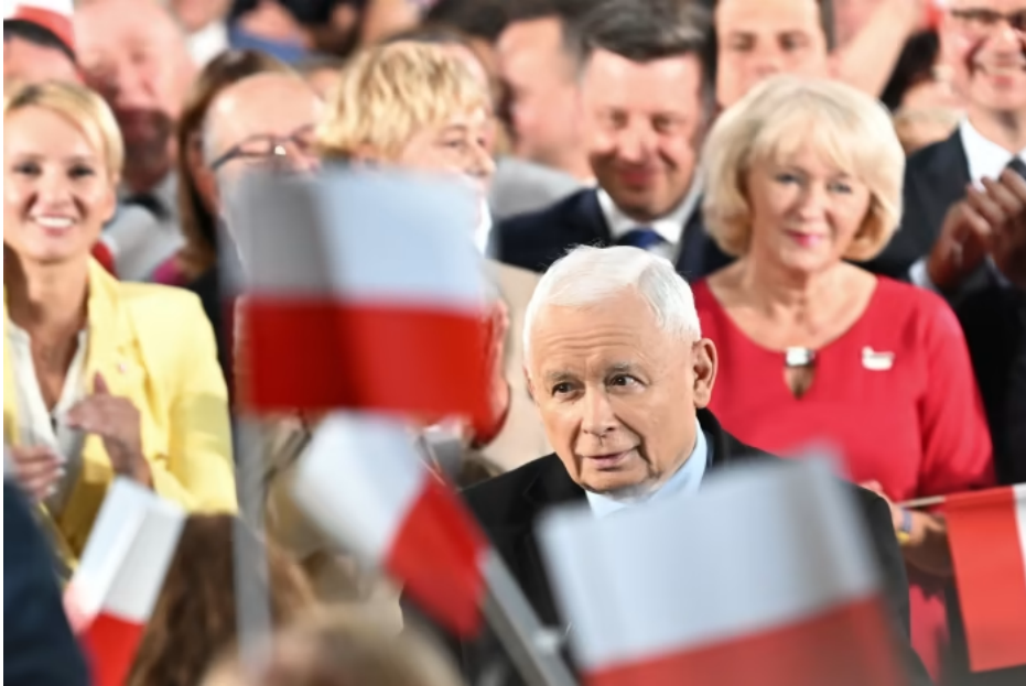
Jarosław Kaczyński, Polish deputy prime minister and leader of the Law and Justice (PiS) ruling party, which during the past three years has lost some support

If that is correct, and PiS stays in power, we can expect more friction with Brussels over the rule of law, EU treaty reform and other areas where conservative Polish nationalists have little in common with the western European political mainstream.